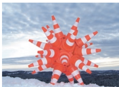
In Out , Plots de signalisation, bois, miroirs en verre de rétroviseurs, miroirs ronds, miroirs bombés, Assemblage vis et silicone, 170 cm Ø, Photo Guillaume Rude