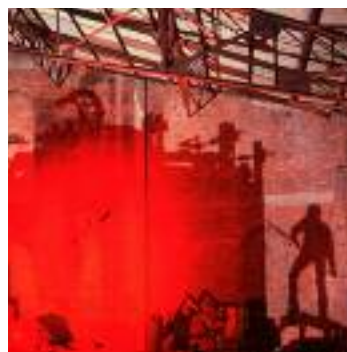
Gérald Wagner (détails de photographies)