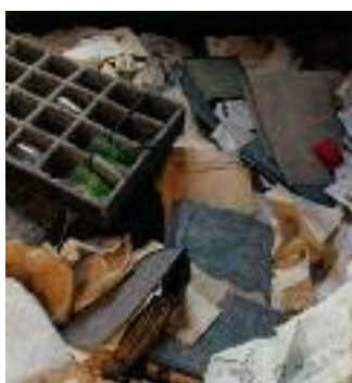
klaus Stöber (détails de photographies)